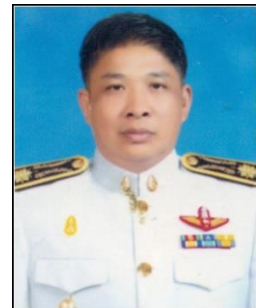
ว่าที่ร้อยตรีสมบุรณ์ ระดม สำนักวิจัยและส่งเสริมวิชาการการเกษตร